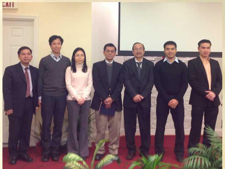
MS và BCH 2013