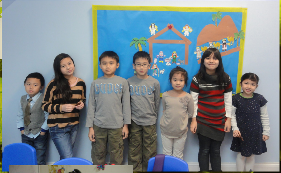
Dâng Con (Dedication)