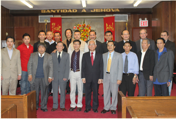
Ban Nam Giới/Men