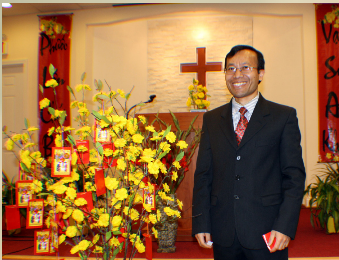
MSNC Ro Gle Ni