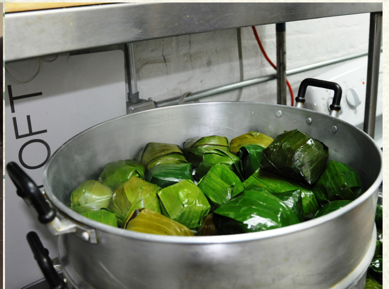
Bánh Tét Chuối + Bún Thang Meetup Fellowship-Tết 2013