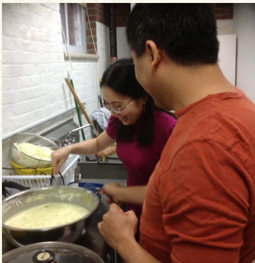
Bánh Xèo Meetup Fellowship