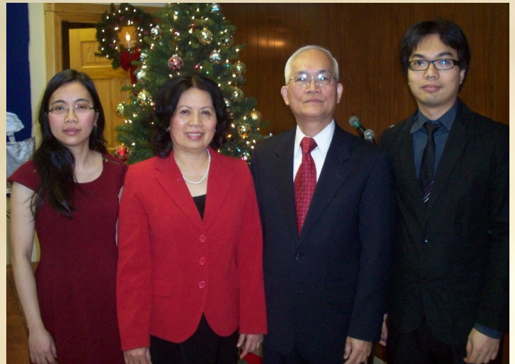
ÔB MS Lê Phước Thuận