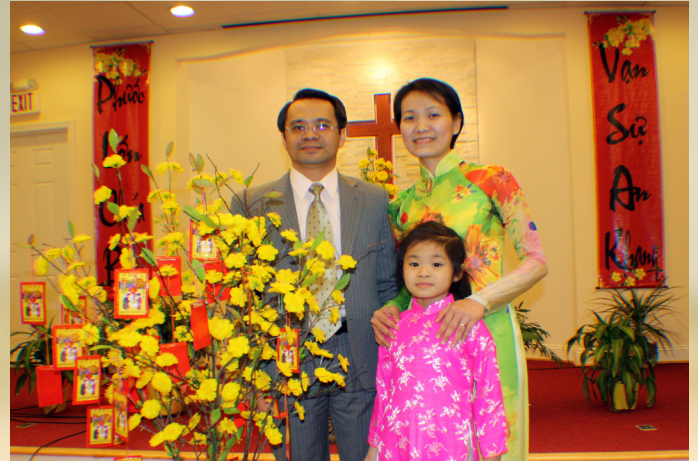
MSNC Thái Phú Quý