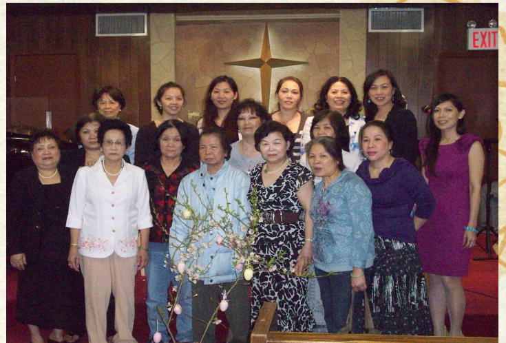
Ban Phụ Nữ/Women